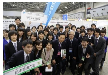
昨年の同イベントの様子

本学からは他に環境学部より 3 研究室、および ISO 学生委員会も出展予定です。